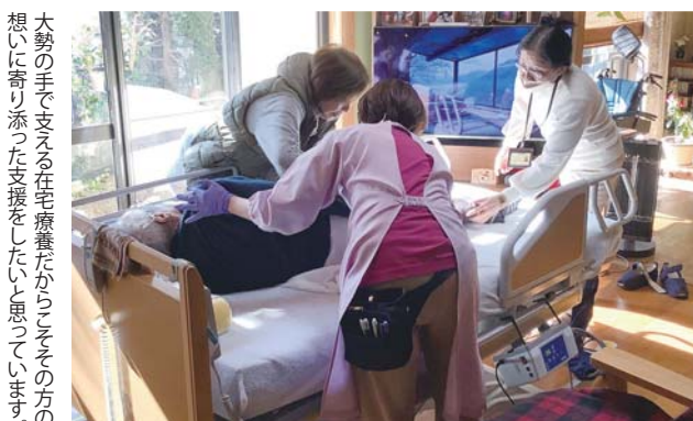
大勢の手で支える在宅療養だからこそその方の想いに寄り添った支援をしたいと思っています。

訪問看護が終了してその後、病状が悪化して入院。どこで最期を迎えるのか？を判断しなければならぬ時期に、体力面・精神面ともに不安を持っているご家族は、お家で過ごすことに自信が持てず迷われていました。でも「帰りたい！」というご本人の言葉に退院を決意し、お家で過ごすことができました。ご家族に「帰れてよかった」と言っていたいただきました。