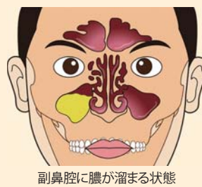
副鼻腔に膿が溜まる状態