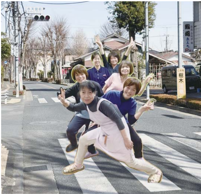
▶ マントをエプロンに替えてチームでみなさんの生きるを支える ナースレンジャー。水天宮前に降臨。